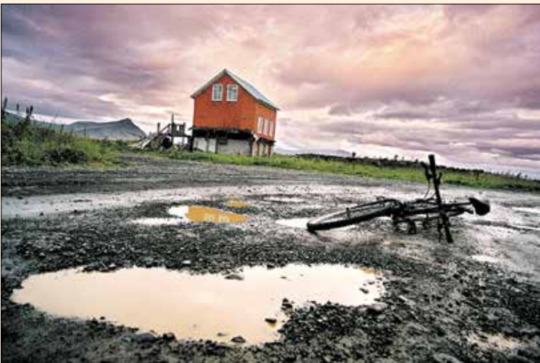
Auch dieses Landschaftsfoto wird in der Ausstellung gezeigt.

Ergänzend zu dieser Ausstellung ist ab dem 17. Mai mit Eröffnung der Schwimmbadsaison im Freibad Goddelau die Ausstellung eines weiteren litauischen Fotokünstlers mit Fotografien von Insekten im Großformat zu sehen.