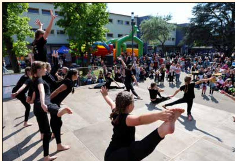
Das vielfältige Bühnenprogramm wie hier die „Dreamdancer“ des TV Crumstadt begeisterte auch im letzten Jahr.

sie zumindest für einen Nachmittag in den Mittelpunkt des Stadtgeschehens rücken. Wie immer wird es viel zu entdecken und zum Mitmachen geben. Da kann mit Tretauto oder Fahrrad ein Parcours absolviert oder sich beim Riesenkicker versucht werden. Sowohl für die ganz Kleinen wie auch für die schon größeren Kinder gibt es diverse Geschicklichkeits- und Bewegungsspiele. Natürlich kann auch gebastelt oder gemalt werden. Zum Toben und Hüpfen stehen wieder Hüpfburgen bereit und auf der Showbühne werden verschiedene Kindergruppen einen Auftritt vor großem Publikum haben.